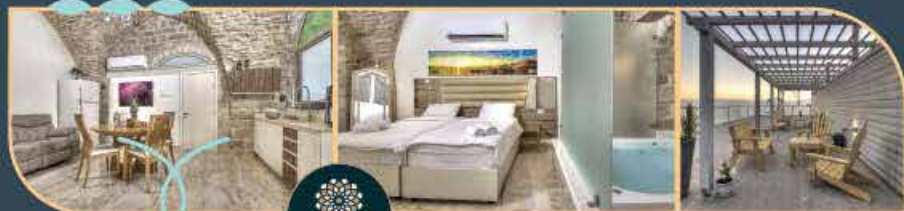
אחוזה בין הקשתות