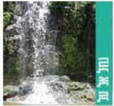
נחל אל ענ

תאור המסלול: מהחניון נרד בסימון אדום לכיוון ערוץ הנחל, לאחר כחצי שעה של הליכה בשביל יבש נגיע לבריכת המפל השחור, נחזור באותה דרך בה הגענו אל החניון.