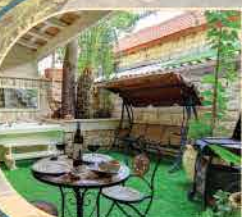
מעין 1 / מעין 2