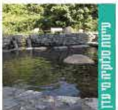
עינת טנקיה מ' עין

מסלול נחמד ופשוט לאורך נחל צלמון ובו זרימת מים מועטה, בריכות שנשקף נמוכות, שרידי טחנות קמח וסבך צמחייה.