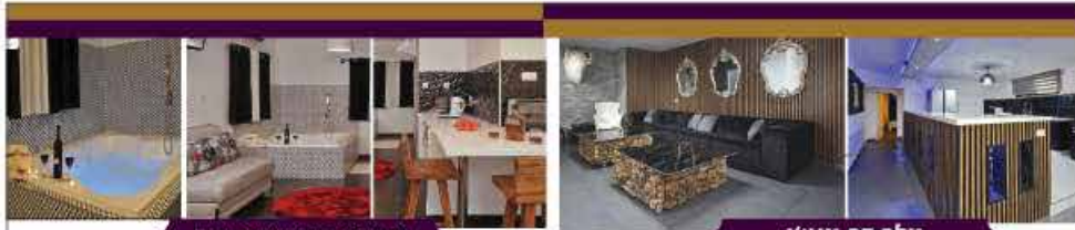
הסוויטה הנשיאותית 5